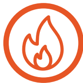
Feux de forêt