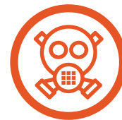
Pandémie (ou éclosions de maladies animales)